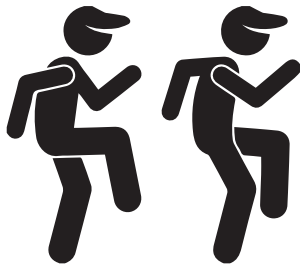
Laufen auf der Stelle mit hohen Knien