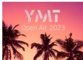
YMT Open Air 10.06.2023