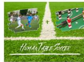
Human Table Soccer 08.07.2023