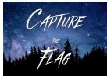
Capture the Flag 23.09.